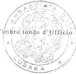
Timbro tondo d'Ufficio

L'Ambasciatore d'Italia Filippo Scammacca del Murgo